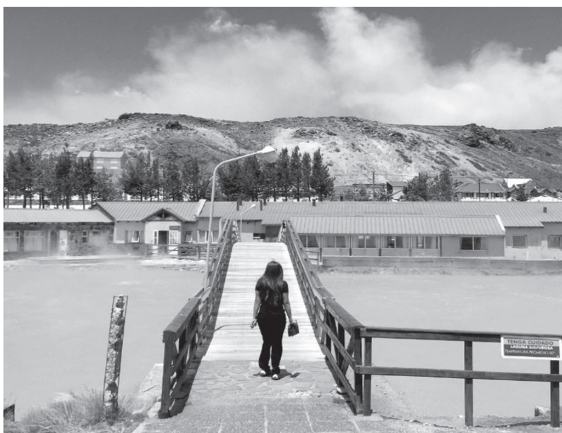
Thermes ou Termas (en espagnol) de Copahue

Qu'y a-t-il au pied de cette montagne? Un therme reconnu pour ses vertus curatives, un sanctuaire de régénération aligné sur les énergies que vous avez explorées. D'ailleurs, la conversation avec le thérapeute rencontré au spa, plutôt que de se focaliser