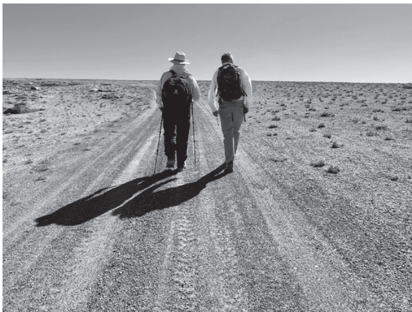
Sur le chemin de retour du Copahue