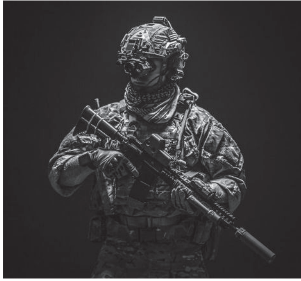
Figure 2. Soldat de l'armée américaine avec des lunettes de vision nocturne.

notre avancée, et là, nous avons été accueillis par deux êtres qui ne ressemblaient pas à des humains. J'ai tout de suite tourné la tête vers le collègue à ma droite et je lui ai demandé : « Tu sais qui sont ces types ? » Ils tenaient une sorte d'objet empilé, difficile à décrire, et semblaient garder l'entrée. L'un des gars à l'arrière s'est alors exclamé : « Ah zut ! J'avais un document à te remettre avant la mission, j'ai oublié de te le donner ! » Il m'a tendu une enveloppe sur laquelle il était écrit : « Ne pas ouvrir. À remettre aux gardiens. » Nous avons donc suivi les instructions et donné le document aux deux êtres qui montaient la garde.